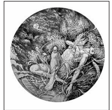
Розбите серце, 2023 р., суха голка

Окрім портретів молодих красунь, які займають центральне місце в експозиції, виставку доповнюють мистецькі парафрази