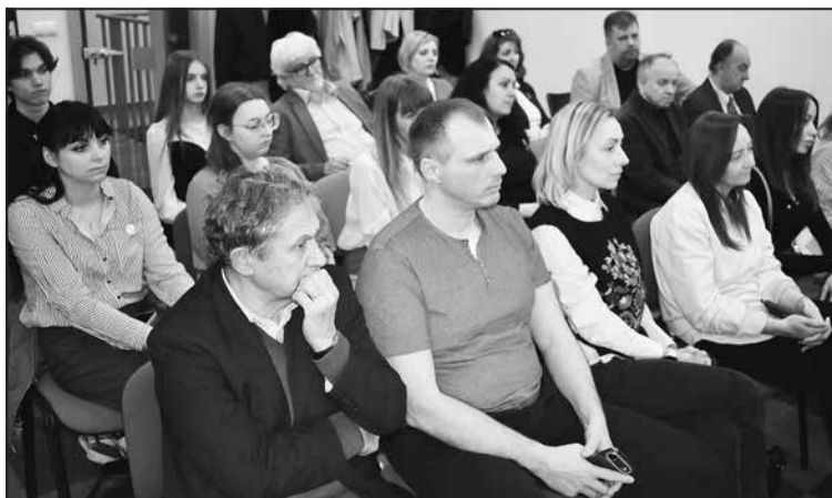
Частина учасників зустрічі.