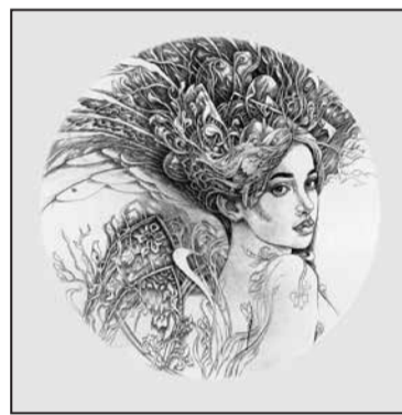
Надія, 2023 р., суха голка

тересів надзвичайно широкий: від дизайну логотипів та книжкової ілюстрації до витонченої китайської каліграфії.