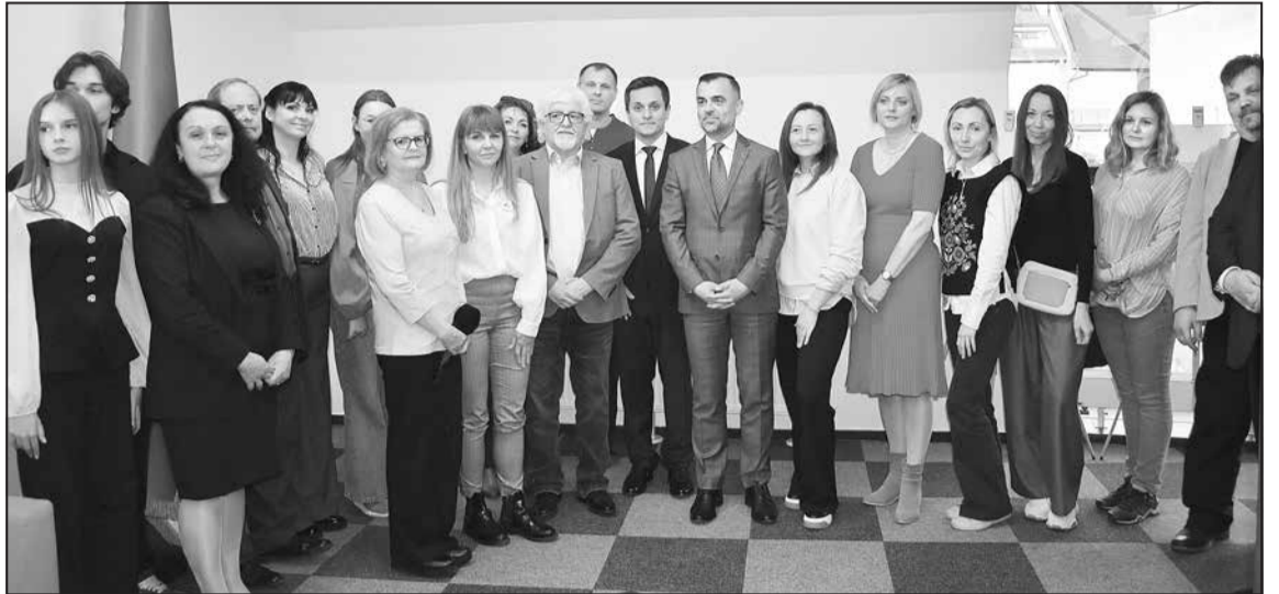
Спільне фото учасників зустрічі.