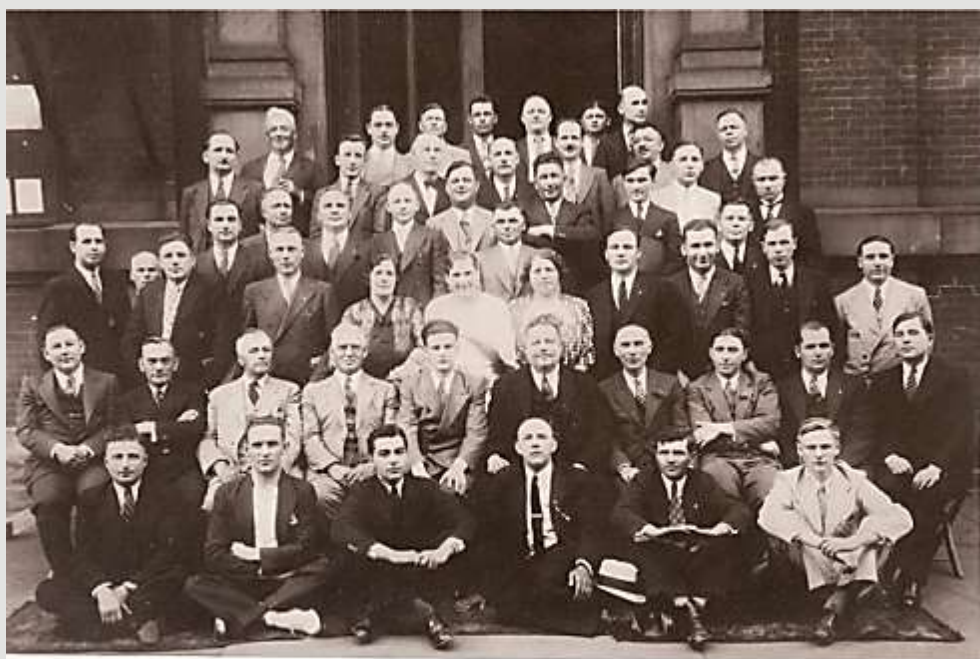
Participants of First Lemko Congress in Philadelphia, 6.VI.1936.

У міжвоєнний період в США виникло кілька установ та організацій, присвячених виключно Лемківщині. Їх завданням було зупинити політику польського уряду, спрямовану на асиміляцію лемків.